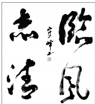
▲ 书法·临风志清 安徽滁州 彭守峰 81岁