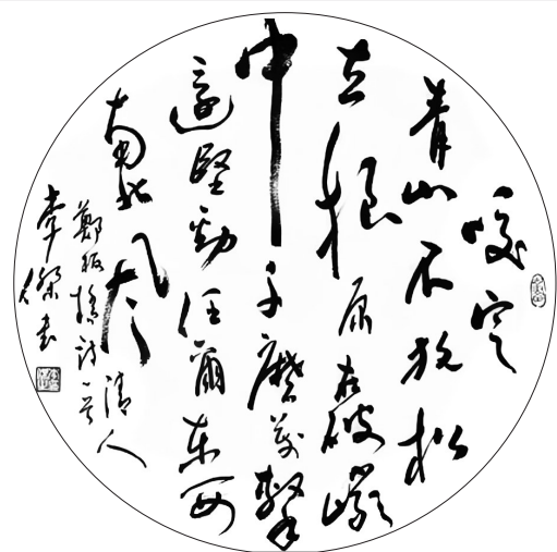
▲ 书法·清代郑燮《竹石》 河北石家庄 李杰 84岁