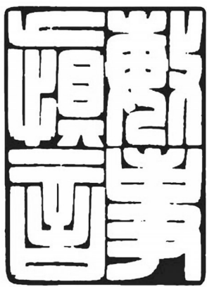
▲ 篆刻·敏事慎言 山东临沂 王平 62岁