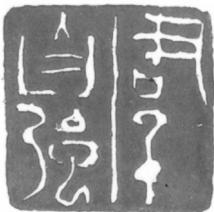
▲ 篆刻·君子自强 河北秦皇岛 王进 74岁