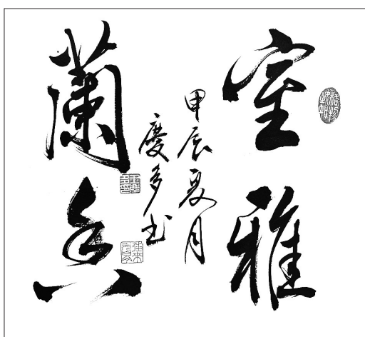
▲ 书法·室雅兰香 江苏南通 王庆多 80岁