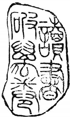
▲ 篆刻·读书破万卷 山东济南 李良义 83岁