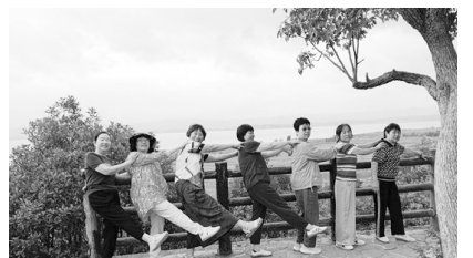
7月20日,打卡草海北坡生态公园。