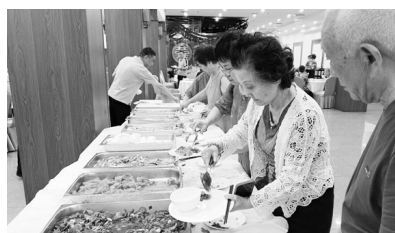
开餐啦,三荤三素,口味清淡,不错!