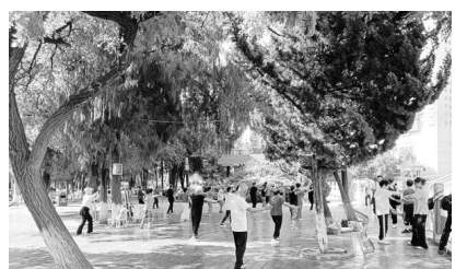
身体锻炼不能少,旁边就是人民公园,好地方。