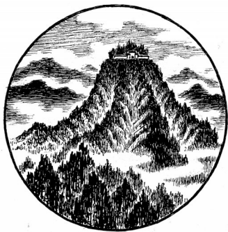
▲ 钢笔画·云雾山林海 陕西石泉 吴俭贵 84岁