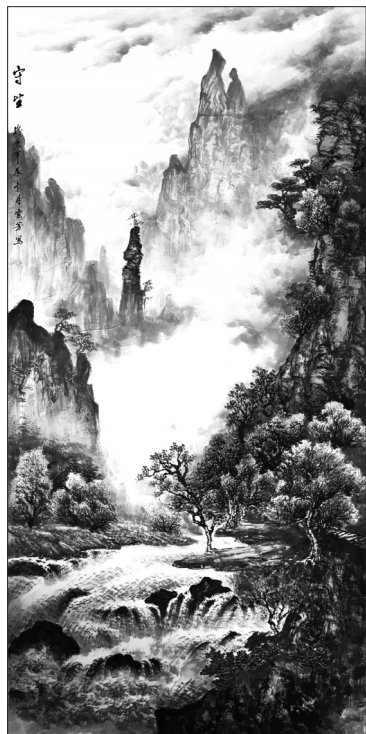
▲ 国画·守望 河北唐山 贾云芳 59岁