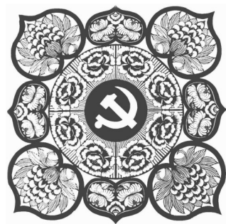
▲ 剪纸·党的光芒照四方 辽宁抚顺 白素菊 58岁