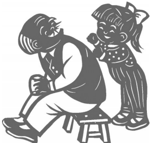
▲ 剪纸·我给爷爷捶捶背 辽宁抚顺 刘桂云 66岁