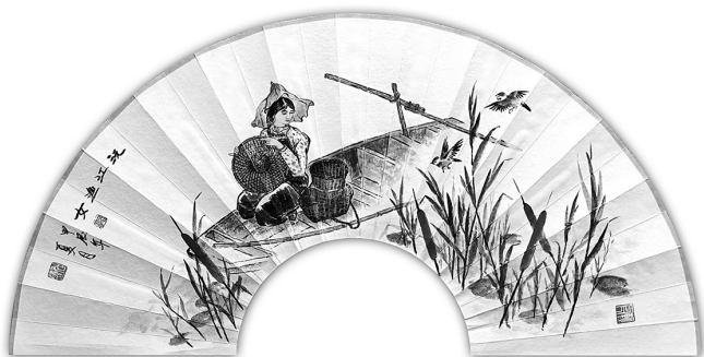
▲ 国画·沅江渔女 湖南常德 郭旭清 67岁