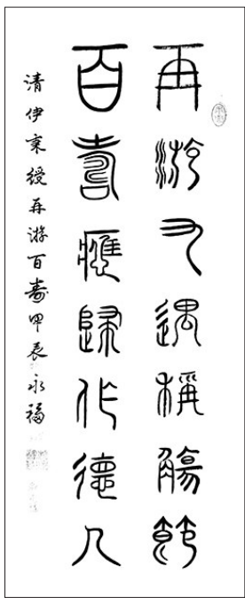
清伊索授再游百善甲辰永福