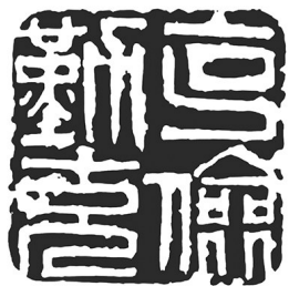
▲篆刻·克勤克俭 辽宁抚顺 徐成文 66岁