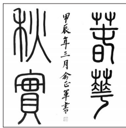
▲书法·春华秋实 甘肃瓜州 俞正军 54岁