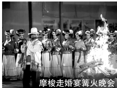
摩梭走婚宴篝火晚会