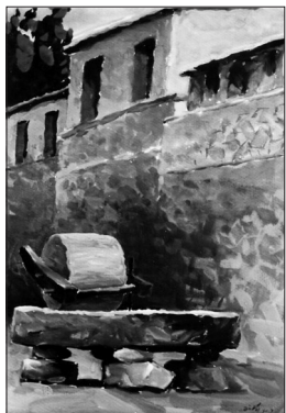
▲水粉·晌午 北京 王永琦 75岁