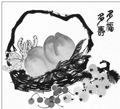
▲国画·多福多寿 辽宁抚顺 徐淑荣 63岁